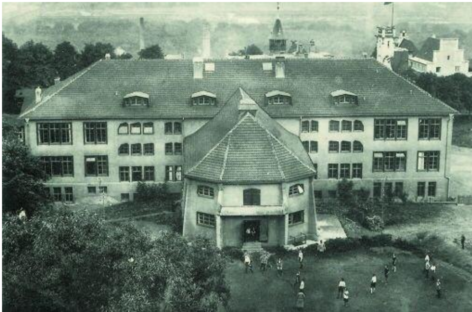
Prva waldorfska škola u Stuttgartu

Nadalje, mnoge poznate javne osobe odlučile su svoju djecu obrazovati u waldorfskim školama. Poznati waldorfski roditelji su primjerice Sting, M. Baryshnikov, Jean-Paul Belmondo, Clint Eastwood, Harrison Ford, Tilda Swinton, Harvey Keitel, Ethan Hawke, Uma Thurman, Ingmar Bergman, Max Frisch, Hans-Dietrich Genscher, Helmut Kohl, Lenny Krawitz, Art Garfunkel, Jessica Lange, Sam Shepard, Robert Plant, Tom Waits, George Lucas, Paul Newman te Gotz Werner koji je javnosti poznat kao osnivač DM lanca trgovina.